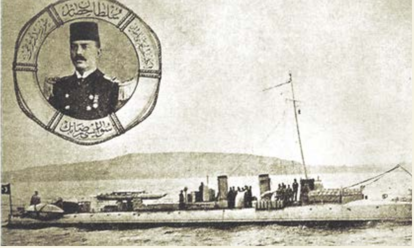
Sultanhisar torpidobotu ve Komutanı Yüzbaşı Ali Rıza Bey

pek çok askerden ismiyle bahsediyordu; onlara ne oldu? Ne zaman “Ben size taarruz değil, ölmeyi emrediyorum” dedi? Bu soruların cevaplarını bulmaya çalışmak pek çok yeni soruyu da doğurdu. Öğrendikçe yeni sorular ortaya çıkıyor, bu sorulara cevap ararken Çanakkale’ye gönül vermiş pek çok insanla tanışıp dost oluyordum. Neticede yarımada topografyasını hafızama kazımak ve konunun uzmanı olan dostlarla konuşmak için sık sık gittiğim bir yer haline geldi.