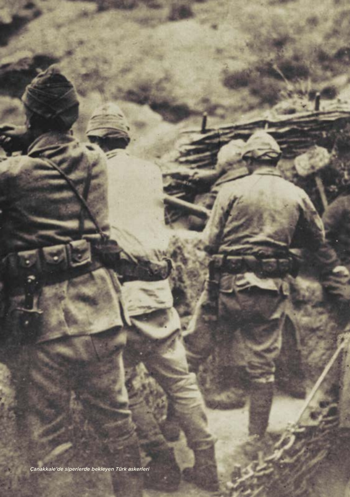
Çanakkale'de siperlerde bekleyen Türk askerleri