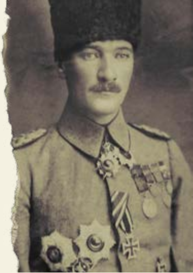
Tümgeneral Mustafa Kemal Paşa