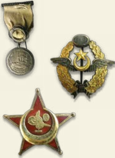
Gümüş Liyakat Madalyası, Osmanlı Tayyareci Alameti ve Harp Madalyası