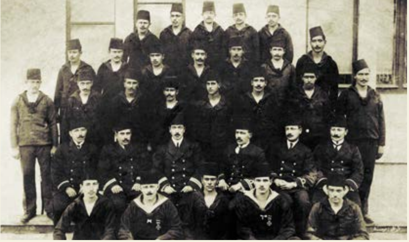
Sultanhisar torpidobotunun mürettebatı

bağrına bastıktan sonra bu ihtiyacı duymamak mümkün değildi benim için.