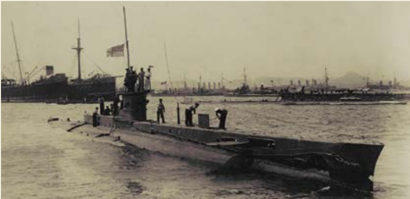
İngiliz E14 denizaltısı