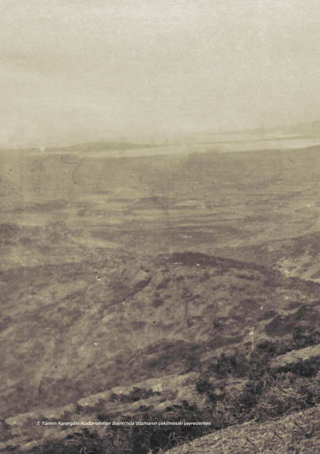
7. Tümen Karargâhı Abdurrahman Bayırı'nda düşmanın çekilmesini seyrederken