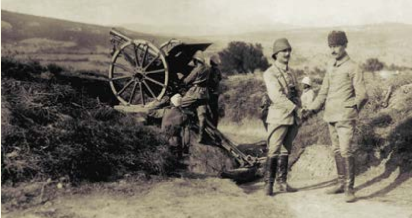
Bir Türk mevziisi

Deniz ve kara savaşlarının ayrı bölümlerde anlatıldığı serginin deniz tarafında, savaşın en şiddetli anlarına tanıklık eden denizaltı ve gemilerce kullanılan torpidoların, 18 Mart'ta işgalci güçlere karşı kazanılan zafere önemli katkısı olan Nusret gemisinin döşediği mayınların, vatan toprağını savunan topların replikaları sergileniyor. Sergide ayrıca Türk, İngiliz ve Avustralya arşivlerinden derlenen çok sayıda arşiv ve sualıtı fotoğrafı, bilgi panoları, haritalar, boğazı geçmeye ya da korumaya çalışan gemi ve denizaltıların batıklarını anlatan belgesel filmler yer almakta.