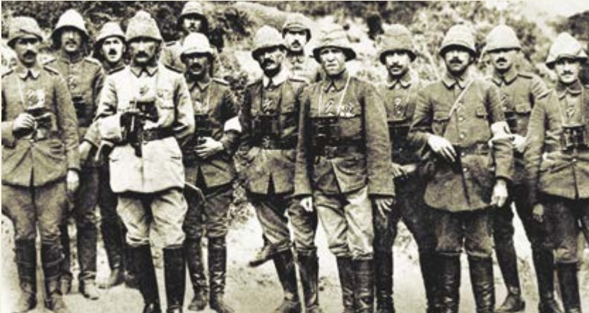
Anafartalar Grup Komutanı Albay Mustafa Kemal Paşa ve silah arkadaşları

Yabancı topraklarda evlatlarını kaybeden annelere yıllar sonra Atatürk tarafından gönderilen mektuptaki ilkelerin izlerini taşıyan sergi, savaşın tüm kahramanlarını ve yazdıkları destanları saygı ve minnetle anıyor.