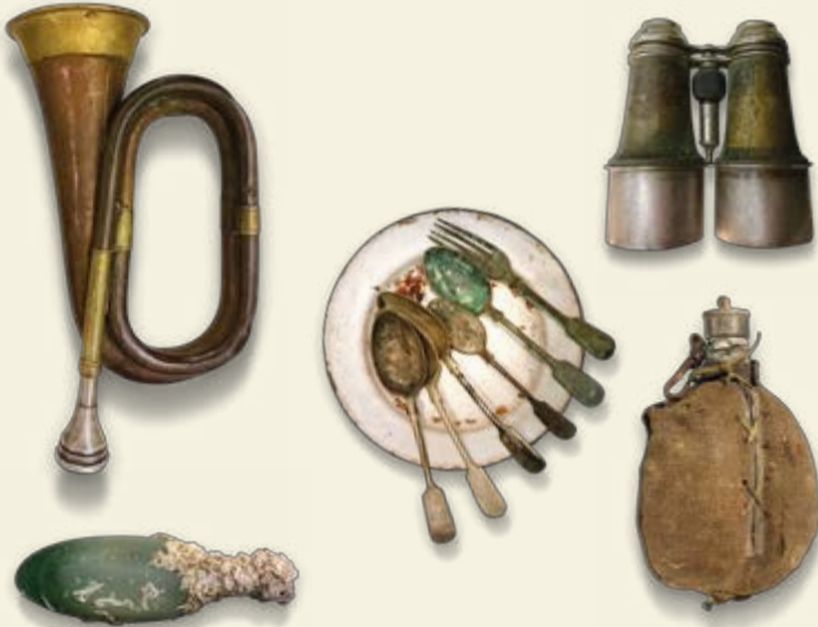
Savaş sırasında askerlerin gündelik yaşamlarında kullandığı objeler

1915'in Şubat'ında Çanakkale Savaşı yalnızca bir deniz harekâtı olarak başladı ve 18 Mart'a kadar boğaz savaşı olarak devam etti. O gün İtilaf Kuvvetleri donanması büyük kayıplar verdikten sonra Çanakkale Boğazı'nı sadece deniz harekâtıyla geçemeyeceğini anlayarak geri