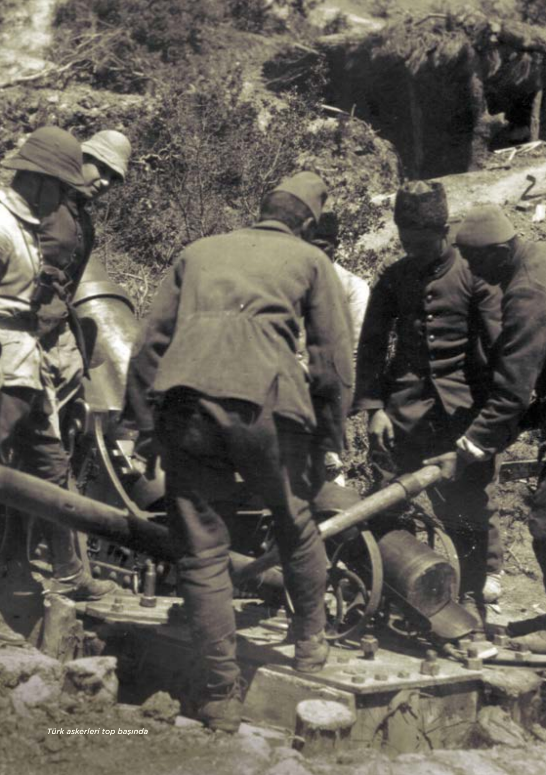
Türk askerleri top başında